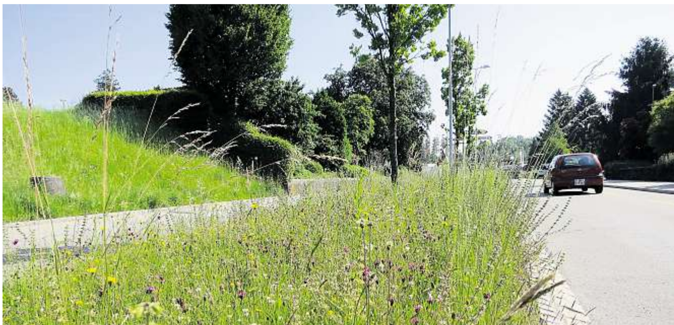
Solche Rabatten sind für die Biodiversität von grosser Bedeutung.

Eine wichtige Fläche im Siedlungsraum nimmt der private Garten ein. Im Februar organisierte das Naturnetz deshalb einen Kurs für Gärtner zum Thema «Naturnahe Gärten». Die Teilnehmenden rühmten den interessanten Tag. Im Herbst ist ein weiterer Kurs geplant. Neben den Gärten sind die öffentlichen